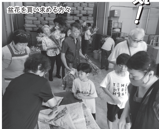
盆花を買い求める方々