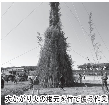
大かがり火の根元を竹で覆う作業