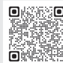
(設備貸与制度サイトへ)