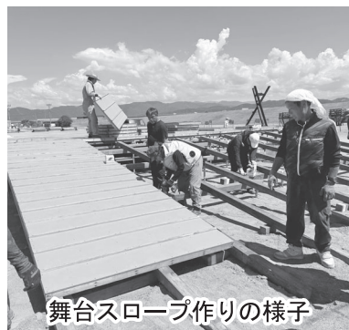
舞台スロープ作りの様子