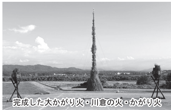
完成した大かがり火・川倉の火・かがり火

7月中旬、83名の会員の方々が大かがり火・かがり火委員として委嘱された。川北まつりから遡ること1週間前の土曜日、7月26日の早朝6時30分より約50名が参加し、大かがり火・かがり火委員が中心となり、丸一日をかけて大かがり火の芯となる鋼管に柴や竹を巻きつける作業が行われた。