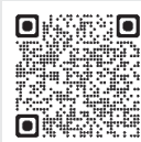
(設備貸与制度サイトへ)