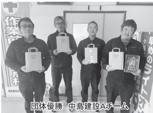
団体優勝 中島建設Aチーム