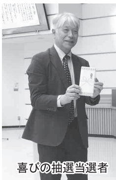
喜びの抽選当選者