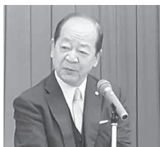
前町長による挨拶