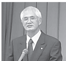
山本会長による挨拶