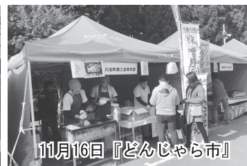
11月16日『どんじゃら市』

10月27日に南加賀公設地方卸売市場で「開設40周年『市場まつり』」、11月16日に白山比咩神社北参道駐車場で「うらら白山人秋祭『どんじゃら市』」が開催され、町商工会青年部員が川北のご当地グルメ「かわきた味噌豚どん」のPR販売を行った。