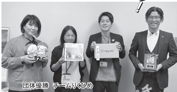
団体優勝 チームりくひめ