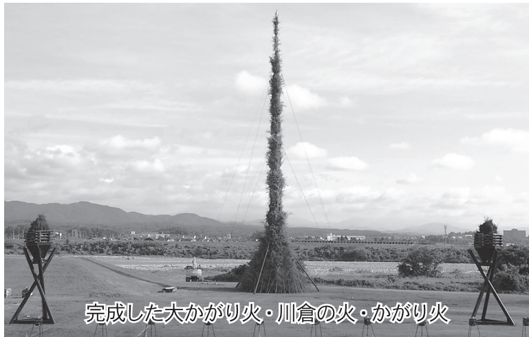
完成した大かがり火・川倉の火・かがり火