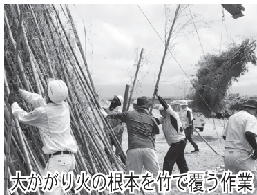
大かがり火の根本を竹で覆う作業