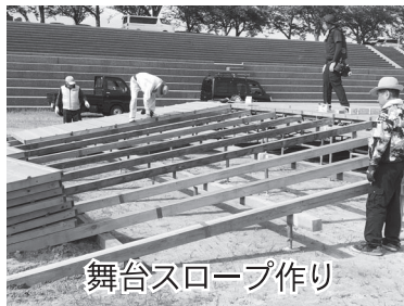
舞台スロープ作り