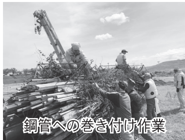
鋼管への巻き付け作業

猛暑の中での作業が 懸念されていましたが、 今年は作業日和の 天気となり熱中症によ る傷病者を出すことな く、皆様のおかげで無 事に作業を終えること ができました。作業に ご参加下さいました皆 様、お疲れさまでした。