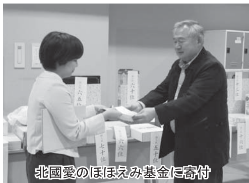
北國愛のほほえみ基金に寄付