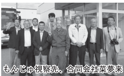
もんじゅ視察先、合同会社菜夢来

また、志賀町にある世界一長いベンチにある世界一イルミネーション(ときめき桜貝廊)の視察も行い、今後の活動に活かせるとても有意義な視察となった。