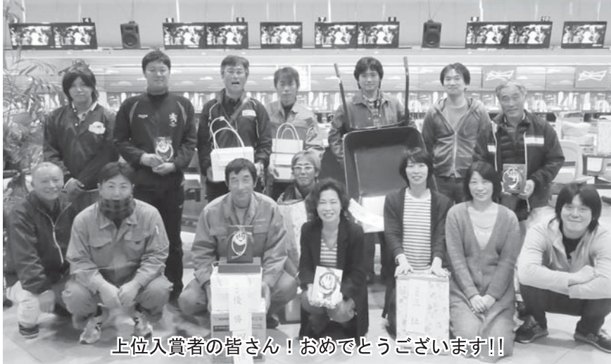
上位入賞者の皆さん！おめでとうございます!!