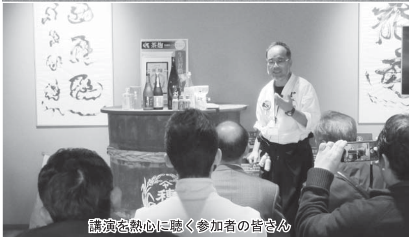
講演を熱心に聴く参加者の皆さん

会員企業研修が11月13日から14日にかけて実施され、会員等27名が鹿児島県の視察を行った。今回の視察は九州復興支援も含んで企画された。 初日は知覧特攻平和会館を見学。第二次世界大戦末期の沖繩戦において、特攻という人類史上類のない作戦で、命を落とした陸軍特別攻撃隊員の遺品や関係資料に触れ、改めて恒久の平和を祈念した。