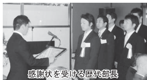
感謝状を受ける歴代部長