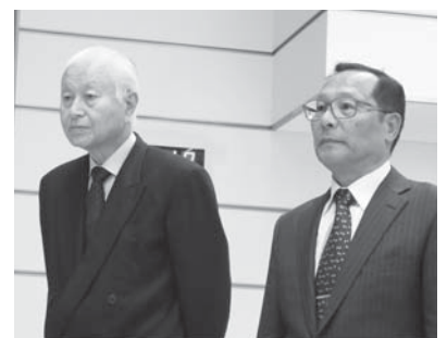
役員功労者表彰受賞の方々