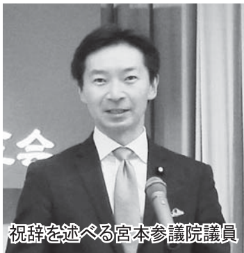
祝辞を述べる宮本参議院議員