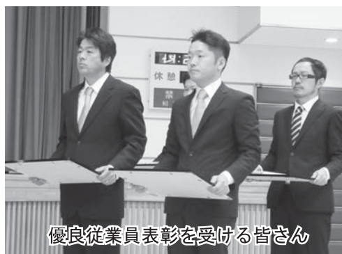
優良従業員表彰を受ける皆さん