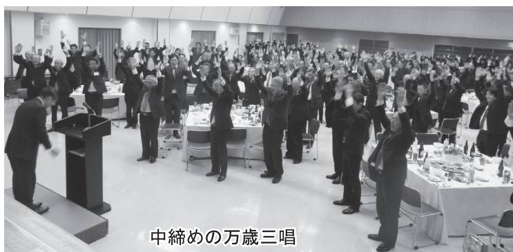
中締めの方歳三唱

恒例の新年懇親パーティーが1月19日、川北町文化センターで開かれ、本会会員、青年部、女性部、来賓者など合わせて約180名が参加し、一年の幕開けを祝った。