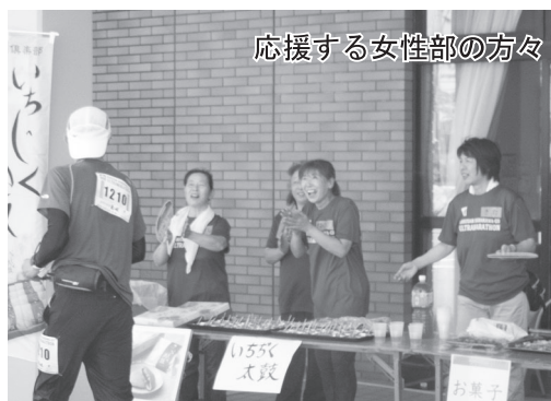
応援する女性部の方々