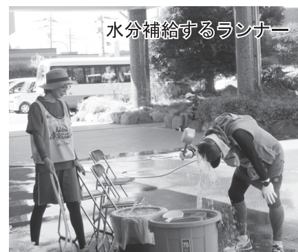
水分補給するランナー

恒例の「青空市」が8月12・13日の2日間開催され、お盆の花や新鮮な野菜を求めて、開店前から大勢のお客さまで賑わった。毎年、買い求める常連客や初めてチラシを見たを訪れた客がお盆の花を一人でいくつも購入され、追加入荷が追い付かないほどの盛況ぶりであった。また、今年は女性部が開発した『いちじく太鼓』に加え『地ビール』の人氣が高く、お盆にいらっしやるお客さまへのお茶請けや、手土産にと買い求められていた。