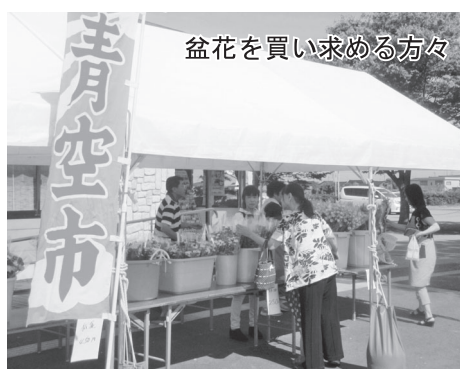
盆花を買い求める方々

恒例の「青空市」が8月12・13日の2日間開催され、お盆の花や新鮮な野菜を求めて、開店前から大勢のお客さまで賑わった。毎年、買い求める常連客や初めてチラシを見たを訪れた客がお盆の花を一人でいくつも購入され、追加入荷が追い付かないほどの盛況ぶりであった。また、今年は女性部が開発した『いちじく太鼓』に加え『地ビール』の人氣が高く、お盆にいらっしやるお客さまへのお茶請けや、手土産にと買い求められていた。