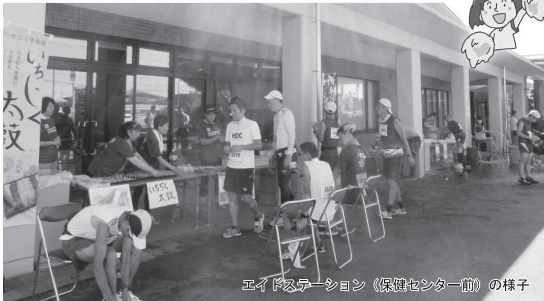
エイドステーション（保健センター前）の様子