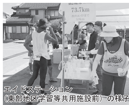
エイドステーション（東部地区学習等共用施設前）の様子

このウルトラマラソンは、白川村の寺尾防災グラウンドをスタート会場とし、白山市の松任総合運動公園をゴール会場とした100kmのコースで行われ、本年度は1104人が出場、431人が完走した。