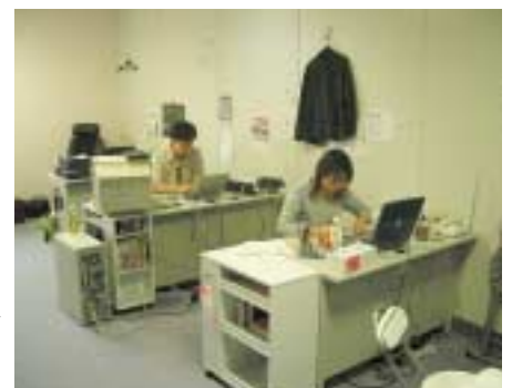
創屋(株)の事務所内

同社は最近「天国からの言葉」と名付けられた風変わりなサービスを開始した。不慮の事故等に備えて、自分の訃報を通知したい人名を登録しておき、実際にそのような事態が発生したとき、直ちに登録先にメールを発信する仕組みである。物騒な世相を反映し